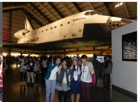
サイエンスセンター訪問