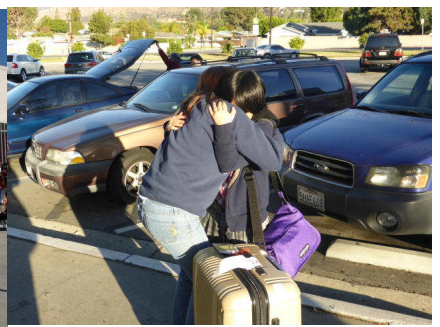
ホストファミリーとの涙の別れ