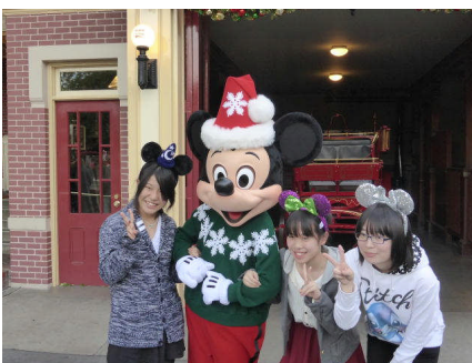
元祖 ディズニーランド訪問