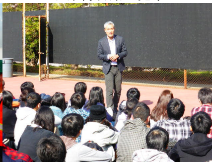
世界で活躍する日本人との懇談