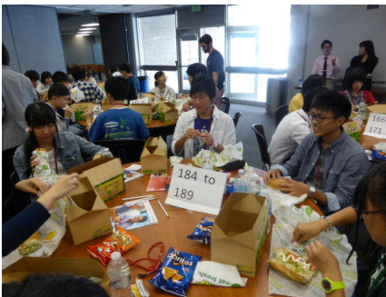
ホストファミリーを待つ緊張の時間

なお、研修内容をホームページの学校だよりのページにアップしておりますので、ご覧ください。