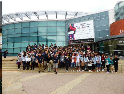
日系博物館の見学