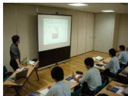
4・5年 大学模擬授業