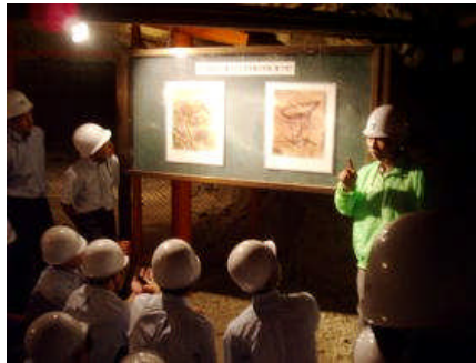
3年 学習合宿・平和学習