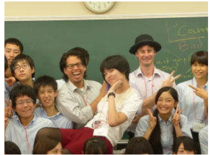
4年 アメリカ事前研修